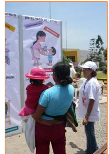
Campagne intégrale de sensibilisation sur la non-violence et le droit des femmes, 8/03/2008

prise en charge intégrale, assuré par des institutions spécialisées : consultation légale par le Ministère Public ; consultation médicale et gynécologique par le Poste de santé « La Fraternité » de la zone « S » de Huaycán ; information relative à l'accès au Système Intégral de Santé (ONG Aspem) ; orientation sociale et sensibilisation sur les formes et les facteurs de la violence familiale (Samusocial Perú, avec le soutien de Pompiers sans Frontières). Sur la base d'une méthodologie participative, chaque femme a également été invitée à écrire un message sur sa perception du droit des femmes et son désir en tant que femme, travailleuse, mère de famille, responsable communautaire, dans la perspective de susciter l'estime de soi et le droit des participantes à s'exprimer. Ces deux campagnes ont permis