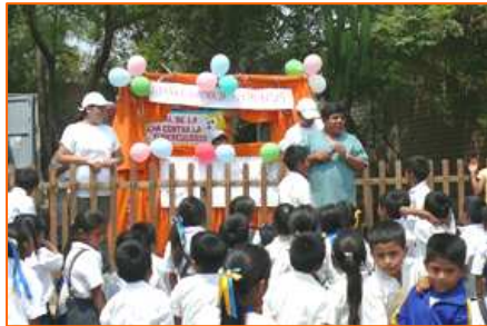
Médecin-chef du Centre de Santé Señores de Los Milagros face aux enfants du collège Mohme Llona participant à la prévention de la TBC. (24/03/2008)