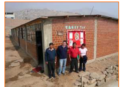
De G à D. : Directeur du Collège Mohme Llona, Directeur de la Children of Peru Foundation, représentants de l'Association de parents d'élèves devant les salles de classe récemment construites (12/05/2008)

salles de classe représentent une avancée importante dans la création de milieux sains et favorables au développement des capacités et compétences des enfants et des professeurs. De même, suite au grave tremblement de terre survenu dans le Sud du Pérou le 15 août dernier, le Samusocial Perú et son partenaire Pompiers sans Frontières - Filiale Pérou, ont pu réaliser une intervention d'urgence, axée sur la sensibilisation de la population à la gestion des risques et désastres, ce grâce à la réactivité de la Children of Peru Foundation . Face aux faibles ressources des familles de la zone sinistrée et les coûts générés par la reconstruction, la Children of Peru a également soutenu la distribution de matériels scolaires aux enfants du collège Fe y Alegría de Chincha (Pisco, Ica). Face au succès des interventions menées jusqu'à présent, le Samusocial Perú et la Children of Peru Foundation continueront à travailler en étroite collaboration dans la perspective du développement global des enfants en situation de grande exclusion.