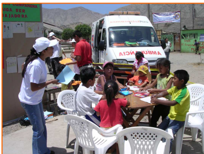
Atelier avec les enfants, Campagne intégrale de sensibilisation sur la non-violence et le droit des femmes, 8/03/2008

Le Samusocial Perú et Pompiers sans Frontières-Filiale Pérou se sont associés aux partenaires de la zone d'intervention à Huaycán (institutions de l'Etat, établissements de santé, société civile) afin d'organiser plusieurs campagnes axées sur l'accès aux soins, la prévention des risques sociaux et la défense du droit des femmes. La Journée Internationale de la Femme du 8 mars et la Fête des Mères du 11 mai ont ainsi été l'occasion de se rapprocher des mères de famille de Huaycán, bien souvent peu informées et dont l'accès aux services de base médico-psycho-sociaux est restreint. Les mamans, accompagnées de leurs enfants, ont été invitées à suivre « un circuit » de