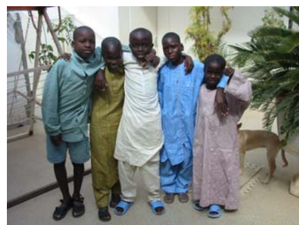
11/01/2006 Fête de la Tabaski