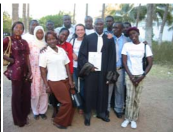
16 mars : Doudou

■ L'Assemblée Générale Ordinaire s'est tenue le 5 février 2005. Les débats ont été extrêmement riches et intéressants. Les membres de l'AG ont également approuvé à l'unanimité le rapport d'activité et le rapport financier de l'association. Les comptes ont été certifiés par le Cabinet Fidéca, commissaire aux comptes. Le samusocialSénégal compte aujourd'hui 44 membres.