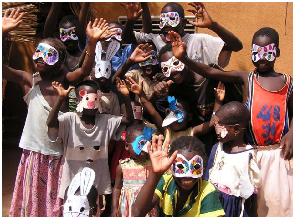
Les enfants au Centre Renaissance.