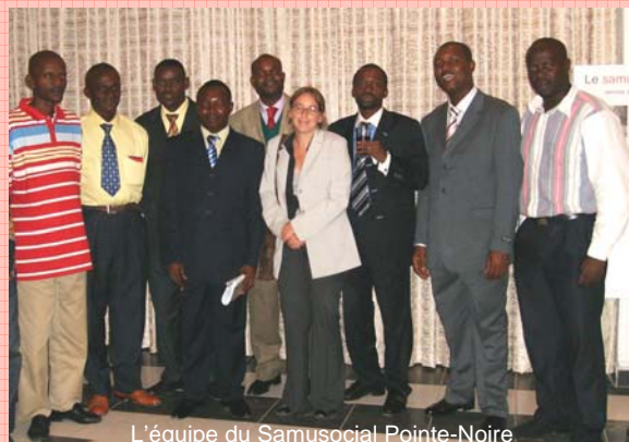
L'équipe du Samusocial Pointe-Noire

Nous remercions chaleureusement les personnes qui nous ont honoré de leur présence le 16 mai dernier.