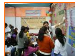
Campagne d'information sur la lutte contre la violence familiale (septembre)

Le Samusocial Perú a poursuivi ses activités de renforcement des capacités de la communauté au troisième trimestre, en participant à plusieurs campagnes d'information en collaboration avec les autorités et les institutions partenaires, principalement sur la prévention de la violence familiale, l'éducation des enfants et le renforcement de l'auto-estime.