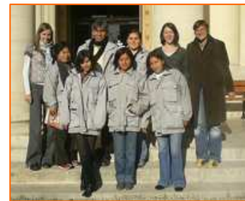
L'équipe du Samusocial Pérou en formation à Paris (novembre)