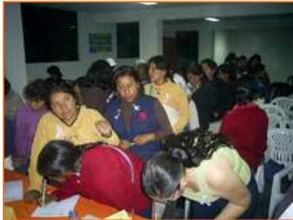
Participant signant la pétition pour l'installation Centre d'Attention d'Urgence pour les femmes victimes de violences à Huaycán

judiciaires. Ainsi, l'installation récente d'un Centre d'attention médico-psychologique à Chosica, situé à une vingtaine de minutes de Huaycán, représente une avancée importante dans la prise en charge des victimes de violences psychologiques vivant dans les zones les plus marginalisées de Huaycán. Auparavant, les victimes étaient, en effet, contraintes d'effectuer les démarches auprès de Centres médico-psychologiques bien plus éloignés pour lancer la procédure pénale aboutissant à la sanction des agresseurs. En dépit de ces avancées, de nombreux progrès restent à réaliser dans l'écoute, le respect et la prise en charge médico-psycho-sociale des femmes victimes de violences. Cet atelier de sensibilisation a d'ailleurs été l'occasion de lancer une pétition à l'attention de la Mairie d'Ate, afin d'obtenir l'installation à Huaycán d'un Centre d'Attention d'Urgence pour les femmes victimes de violences. Le soutien de la Communauté de Huaycán à ce projet, ainsi que la participation massive des dirigeantes communautaires à cet atelier de sensibilisation, témoignent d'ailleurs de la détermination de la Communauté à lutter, au jour le jour, contre l'impunité et les violences faites aux femmes.