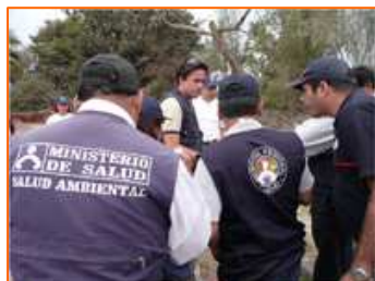
Coordinateur de PSF Filiale Pérou formant des responsables en Santé environnementale de l'Hôpital de Huaycán (Pisco, Pérou)