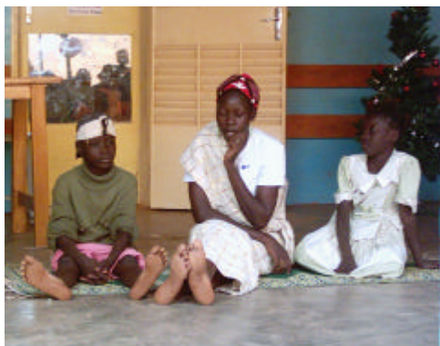
Théâtre avec les enfants hébergés et l’équipe du Samu