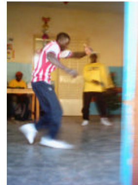
Collectif de danse hip-hop