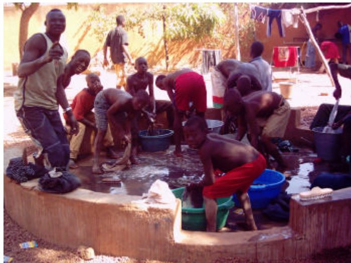
Accueil de jour au Centre Renaissance

Le Samusocial ouvre un accueil de jour 6 matinées de la semaine au niveau du Centre Renaissance. Les enfants ont accès à des soins gratuits peuvent s'entretenir avec les agents du Samusocial et les lundis, mercredis et vendredis ils peuvent se laver, laver leur vêtements et éventuellement se faire couper les cheveux : nous leur donnons alors lessive et savons. Ce sont ces trois jours où l'affluence est la plus grande au Centre depuis 2 mois environ nous avons une moyenne de