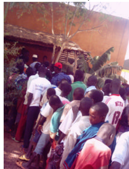
Distribution du repas de Noël