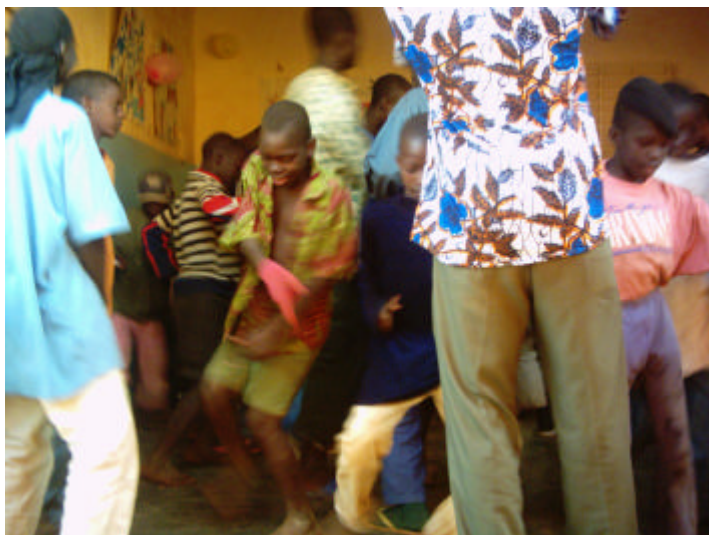
Les enfants en plein coupé décalé...