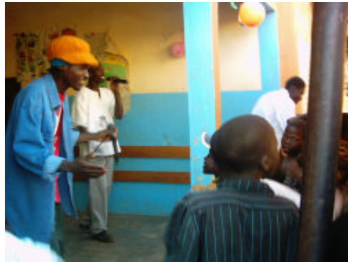
Le groupe de Rap « Wenteng Clan » en live