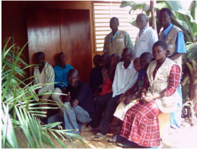
Les enfants revenus du Mali avec les agents du samusocial Burkina Faso

Suite à ce premier contact les équipes du Samusocial Mali ont poursuivi les entretiens et le suivi en rue de ces enfants. Parmi ces enfants, dix ont paru réellement déterminés et un retour en famille a alors été programmé.