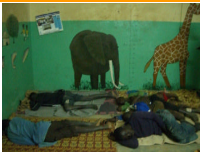
Nuit au Centre Renaissance,