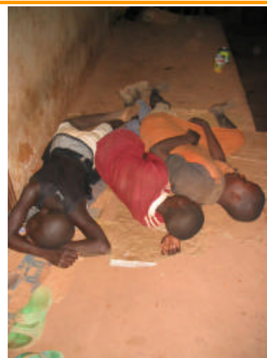
et nuit en rue.