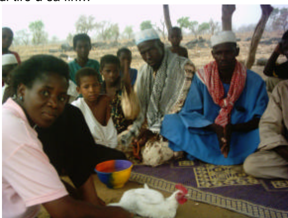
La responsable sociale du samusocial, l'enfant, et sa famille