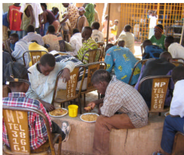
Le repas de Noël