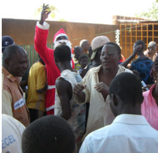
Les enfants et le père Noël...