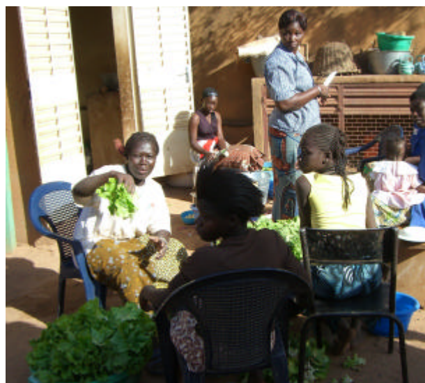
Préparation du repas, avec les filles hébergées et l’équipe d’encadrement.